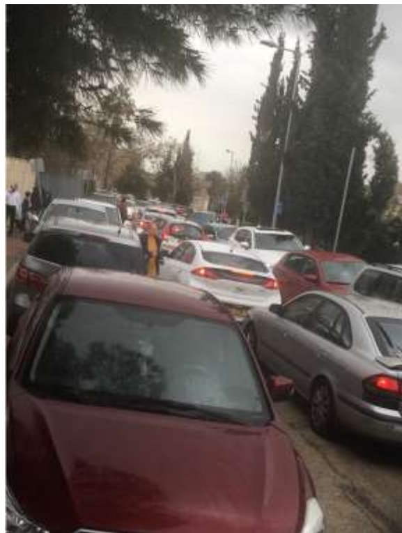
בתמונה: רחוב סרנא בשעת עומס גדול

כידוע, רחוב סרנא מכיל מספר מוסדות חינוך משמעותיים בשכונה: בית הספר הממ"ד, שני גני ילדים בתחילת רחוב סרנא, וגן נוסף מול בית הספר. בנוסף בתחילת רחוב אביעד יש את גן ימית. ריכוז מוסדות החינוך מביא תנועת רכבים גדולה בשעות הפיזור והאיסוף ולעיתים קרובות נוצר פקק ע"י מכוניות הבאות מרחוב גולד מול מכוניות מצד שני והדבר סותם את הרחוב ולא ניתן לזוז.